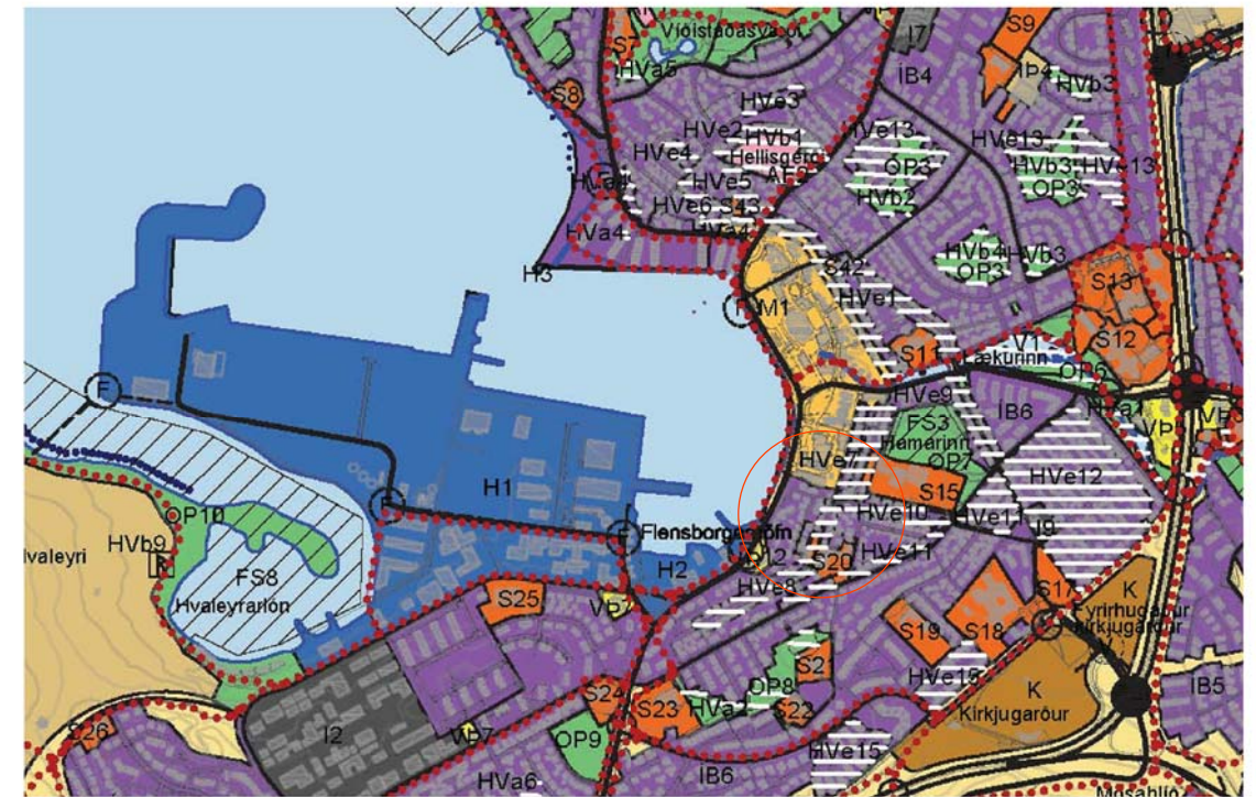
Hluti að aðalskipulagi Hafnarfjarðar 2013-2025